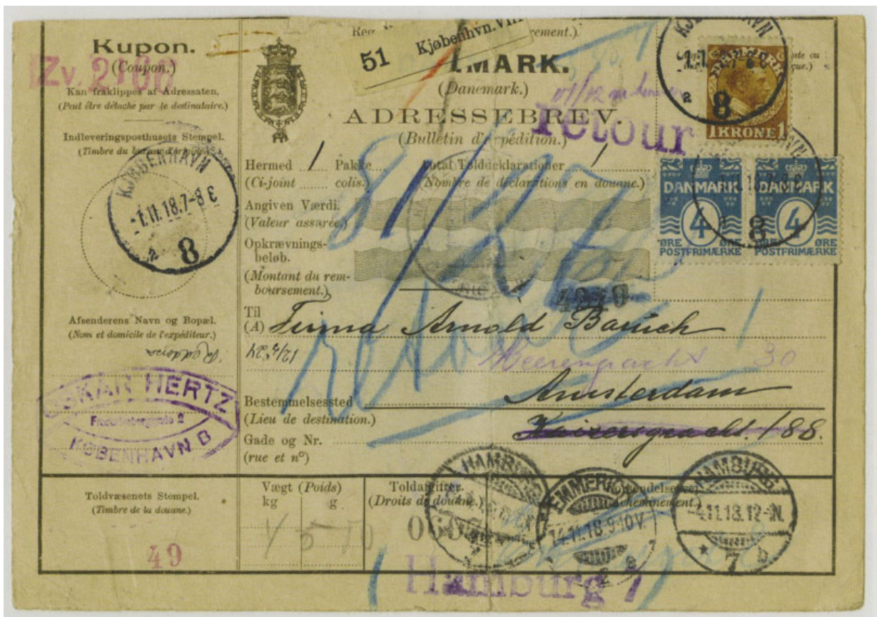
Forsiden på adressebrev på pakke til Holland sendt 1. november 1918. Bemærk de mange stempler: København 8 1.11.1918 - Hamburg 7 4.11.1918 - Emmerich 2 14.11.1918 - samt Hamburg 7 igen utydeligt men formentlig 14.1.1919. - stempel retour samt Hamburg 7 i violet, formentlig påført i Holland - retour påført i blåkridd i Danmark sammen med portodeling 81/27 som er fordeling af fremmed og dansk porto

Midt i al dette er en pakke med kamme af horn på vej fra København til Amsterdam via Tyskland. Jeg har egentlig købt dette adressebrev på grund af destinationen, fordi det omhandler en pakke fra Danmark til Holland, og det er mig bekendt det eneste kendte adressebrev/adressekort til denne destination før 1945. Taksten er 108 øre. Pakken bevæger sig igennem 3 lande: Danmark, Tyskland og Holland og repræsenterer derfor en meget typisk pakketakst i perioden 1880 til 1921: 36 øre for hvert land pakken går igennem, altså 108 øre. Der er tilsvarende takster til Belgien (Danmark-Tyskland-Belgien) og Schweiz