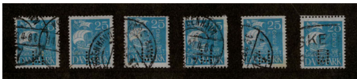
AFA 171 - 25 øre karavel blå forsynet med perfin M01 og afskærne takker foroven og forneden

For at POKO-maskinen kunne fungere, skulle den forsynes med frimærker i ruller. Jeg ved ikke, om det er alment kendt, men postvæsenet fremstillede faktisk