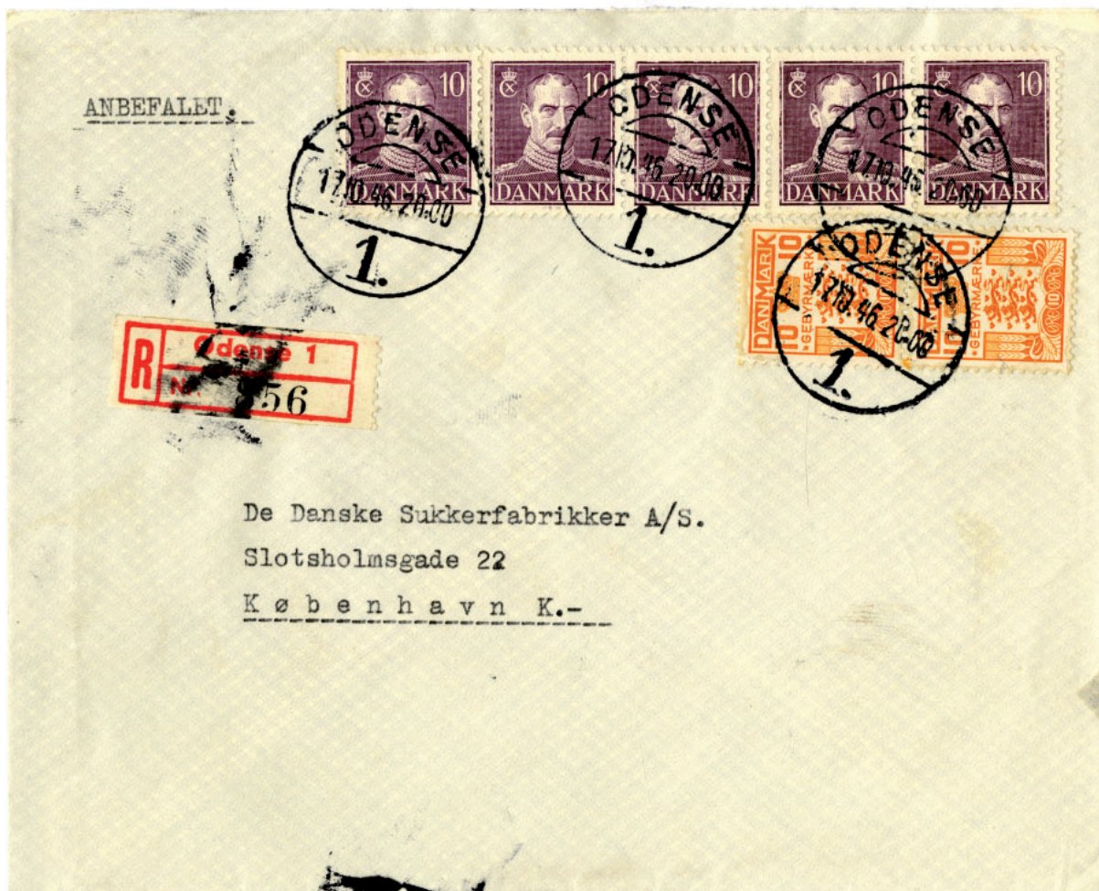
Anbefalet brev sendt 17/10 1946 fra Odense 1 (banegården) til København. Indleveret udenfor normal åbningstid: kl. 20.00. Takst brev 0-20 g.: 20 ore plus anbefalingsgebyr: 30 ore, ialt 50 ore. Dertil 20 ore i gebyr