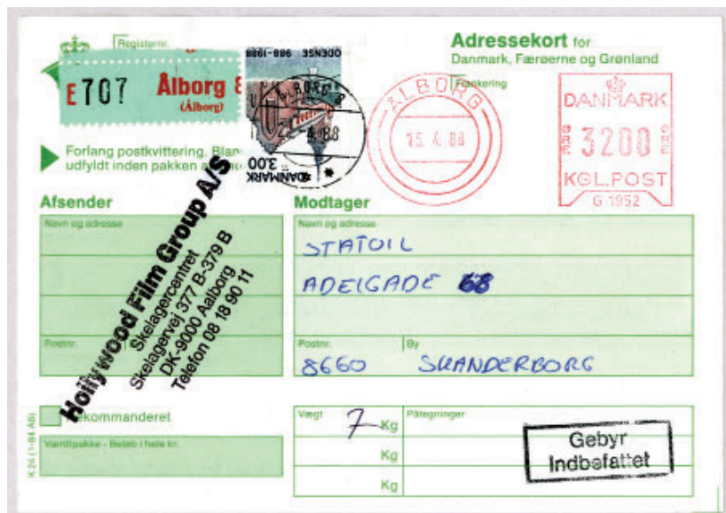
Pakke sendt 15/4 1988 fra Aalborg 8 (Algade) til Skanderborg. Pakketaksten er frankeret med frankomaskine, sikkert posthusets, mens gebyret for indlevering udenfor normal åbningstid: 300 ore er betalt i frimærker. Bemærk at frimærket er annulleret med et af de sjældne „postsparebogsstempler

for den almindelige åbningstid, men det er altså først fra denne dato.