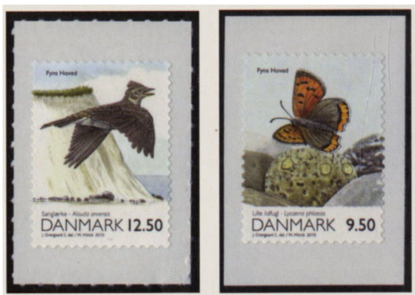
Til venstre et mærke fra et helark. Bemærk perforeringen på bagpapiret. Til højre et mærke fra en souvenirmappe - bemærk den renskårne kant!

Som i Tyskland er der også ved disse frimærker forskel i takningen mellem selvklæbende og spytklæbende (hvis man kan kalde de udstansede mærkerandende for ”takning”), men desværre er forskellen ikke så markant som hos tyskerne, så man må have fat i takkemåleren.