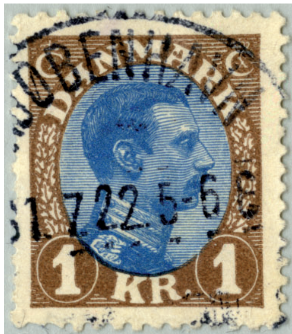
Stor pladefejl - pos. 33 - Farvet prik i andet A i Danmark - her 1. tryk

En anden besynderlighed er den store pladefejl i rammetrykpladen til type 1: position nr. 33: ”Stor farvet plet i andet A i Danmark”. Det er en pladefejl – variant – som uden videre diskussion burde finde plads i ethvert Danmarkskatalog. Den er iøjnefaldende, tydeligt at se med det blotte øje, og betydningsfuld, fordi den faktisk bliver opdaget og fjernet i løbet af produktionen.