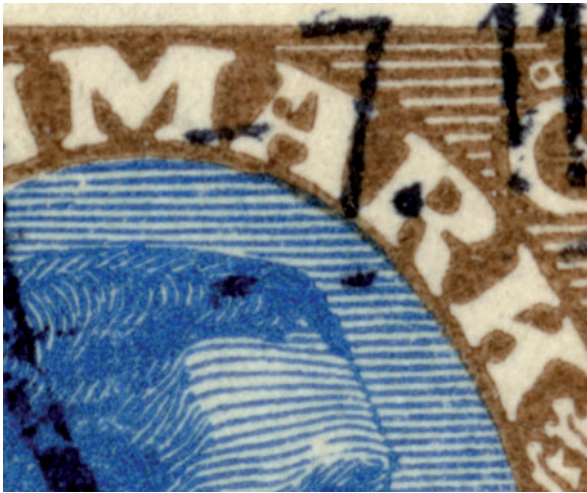
Pladefejlen i nærbillede

er mange helark med postfærgeovertryk. I 7. tryk er varianten fjernet. Eftersom det er en farvet plet i et hvidt område burde det forholdsvis let kunne lade sig gøre at bortretouchere den.