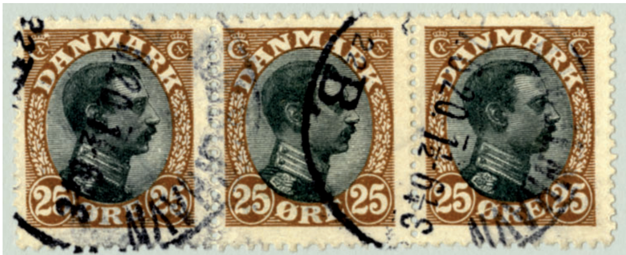
3 stribe afstemplet 7.6.1920 - indtil videre tidligst kendte dato for denne udgave

øre brun, 35 øre gul og 50 øre rødbrun. I princippet også 80 øre blågrøn, men den var der så lidt brug for, at det ikke kom til at ske. Man udgav som bekendt nye værdier: 27 øre, 30 øre og 40 øre i tofarvet udgave allerede i slutningen af 1918. 50 øre blev hurtigt erstattet af en ny tofarvet udgave (2. januar 1919), 35 øre fulgte forholdsvist snart efter (26. juni 1919), mens der som nævnt gik 1 ½ år før der var brug for at erstatte den ensfarvede 25 øre med en tofarvet udgave. Det skyldtes dels, at der var store lagre af 25 øres mærker ved årsskiftet 1918/19, samt at behovet for 25 øre faldt drastisk netop på samme tidspunkt på grund af ændrede portosatser. Den væsentligste sangleanvendelse var som anbefalet indenrigs brev, mens