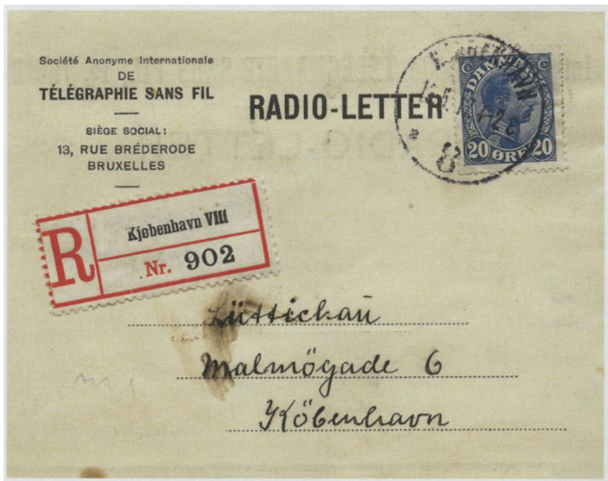
Radiobrev sendt 9. maj 1917 fra Oscar II via Hellig Olav. Indleveret på København 8 (Frihavnen) 15. maj 1917 til viderebefordring. Forsynet med liniestempel på bagsiden „Hellig Olav“

“Radiobrev - Radiomeddelelse eller radiotelegram fra et skib, som efter modtagelsen nedskrives og udbringes til modtageren gennem postvæsenet. De første radiobreve i Danmark fremkom i slutningen af tyverne som radiomeddelelser modtaget af fjernere skibe af DFDS-skibe i indenrigsrute fart, der regelmæssigt kom i havn, hvorfra de kunne poste meddelelserne. Den 1. april 1934 blev kyststationerne Lyngby og Blåvand