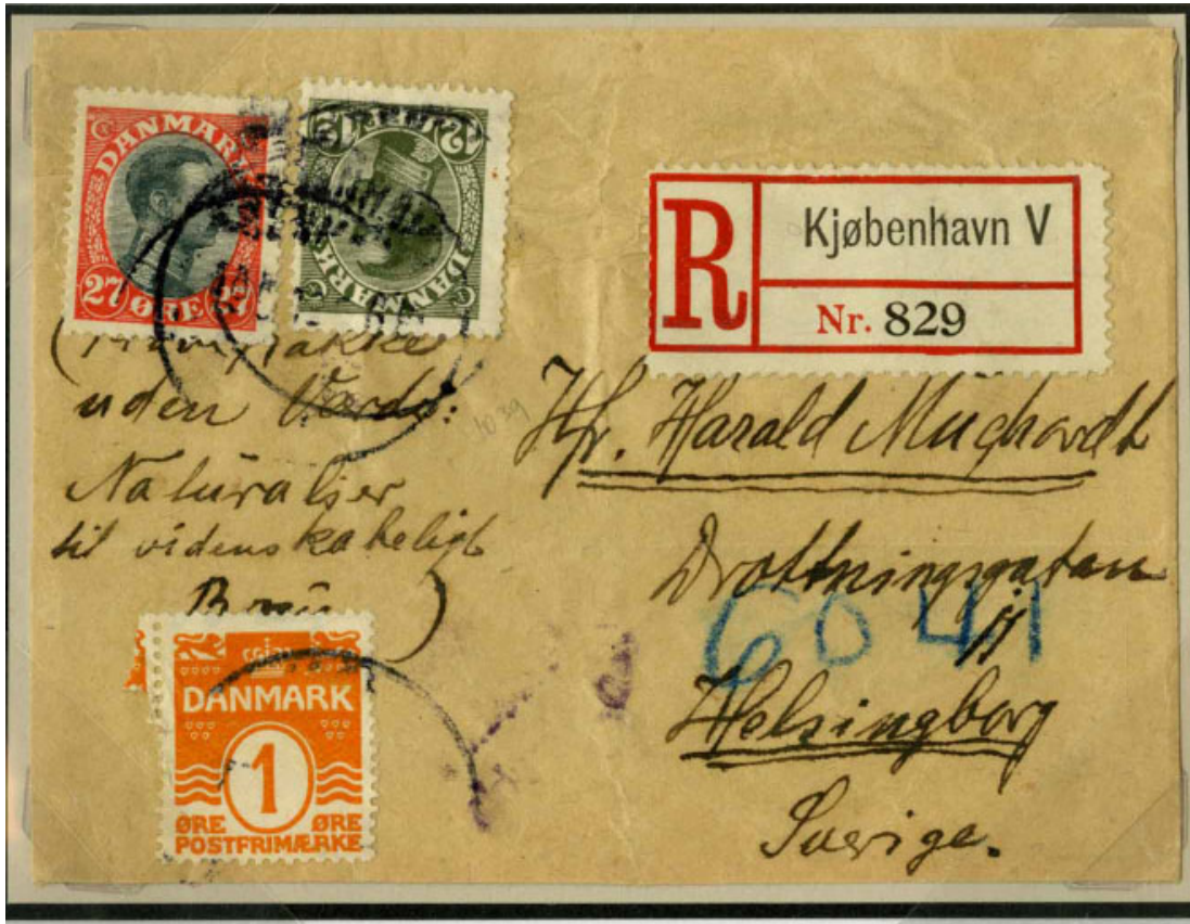
Fig. 8 ovenfor og fig. 9 nedenfor