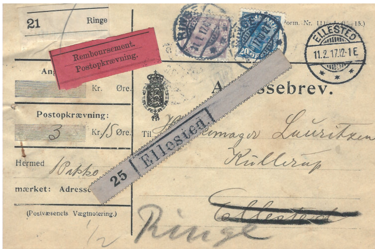
Adressebrev på pakke returneret 11.2.1917 fra Ellested til Ringe - der opkræves ikke gebyr

De efterfølgende takstændringer har jeg ikke umiddelbart haft mulighed for at opspore.