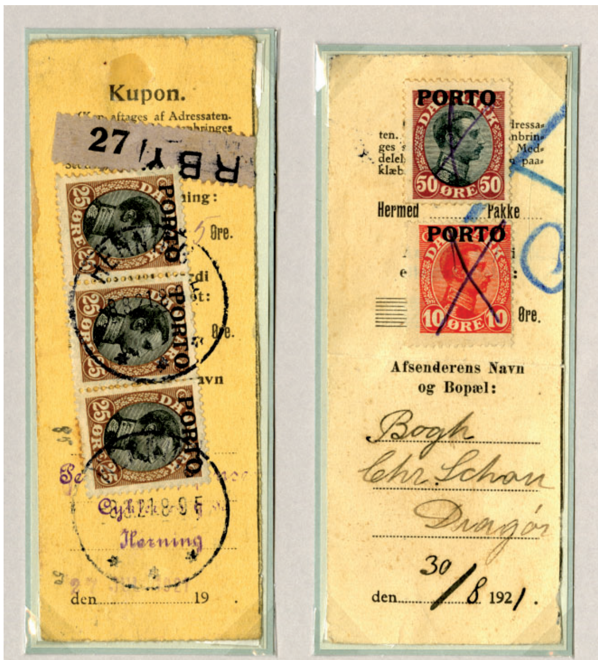
To kuponer fra interimperioden 1. marts 1921 til 1. april 1922, hvor der opkræves fuld vægtporto for returnering af indenlandske pakker - kuponen til venstre er for en landsportopakke 1-3 kg (75 øre), mens kuponen til højre er for en landsportopakke 0-1 kg (60 øre)

jer, men alle de adressekort på returnerede udlands-pakker, jeg kender til, er pålagt en returporto, som er lig den vægtporto, som pakken vil koste at fremsende på returneringstidspunktet plus evt. påløbne omkostninger.