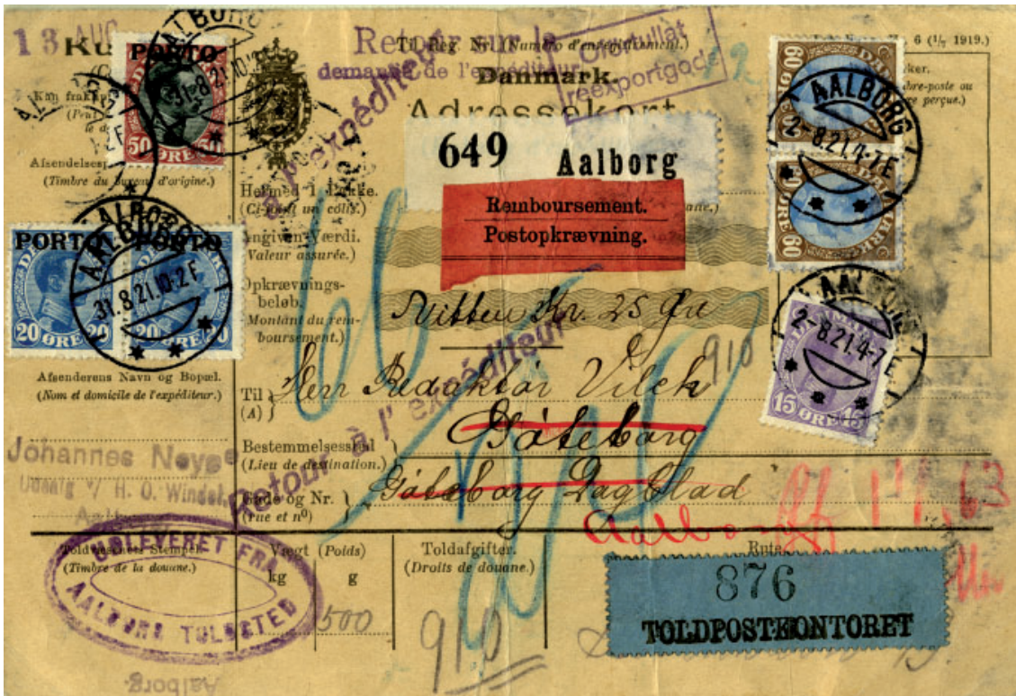
Adressekort på pakke 0,5 kg med postoprævning 19,25 kr. sendt 2/8 1921 fra Aalborg til Göteborg i Sverige. Pakken returneres på anmodning af afsenderen: „Retour sur la demande de l'expéditeur“; som er påført med lilla stempel foroven midtfor. Fremsendelsesporto var 90 øre for en pakke 0-1 kg til Sverige og 45 øre for postoprævning 5-50 kr.. Returporto er vægtporto = 90 øre. Med blåkridd er påført portodelingen mellem det svenske (66 øre) og det danske postvæsen (24 øre)