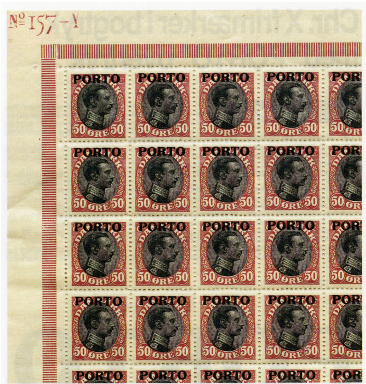
Øvre venstre marginalblok med matricefejl i nr. 14 og 23 samt pladefejl i nr. 32 (i overtrykspladen)

I AFA Specialkatalog 1995 er nævnt en såkaldt matricefejl, som går igen et antal gange i arket: „Hak foroven i R“, samt en pladefejl „Kraftigt overtryk“ nr. 95 i arket.