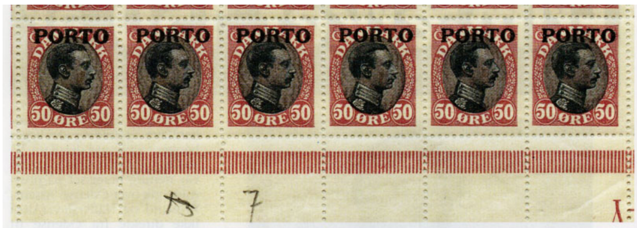
Nedre højre marginalblok med pladefejl i nr. 95 samt matricefejle i nr. 96, 97 og 98

til at følge artiklerne i NFT op med de værdier, der mangler at blive publiceret noget om, men lad dette være anledningen til at overveje en revival. Jeg har dog i AFA Specialkatalog 1987-88 s. 504-530 beskrevet de vigtigste „samleværdige varianter“ i udgaven.