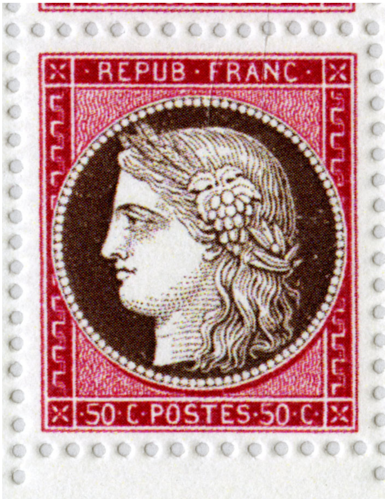
Forfalsket mærke med den sædvanlige skravering i trykket