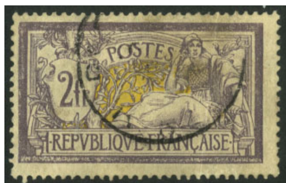
Ægte mærke AFA 99

På de forstørrede afbildninger på næste side skulle det gerne være krystallklart, hvorfor jeg mener, at firklokken er en helforfalskning.