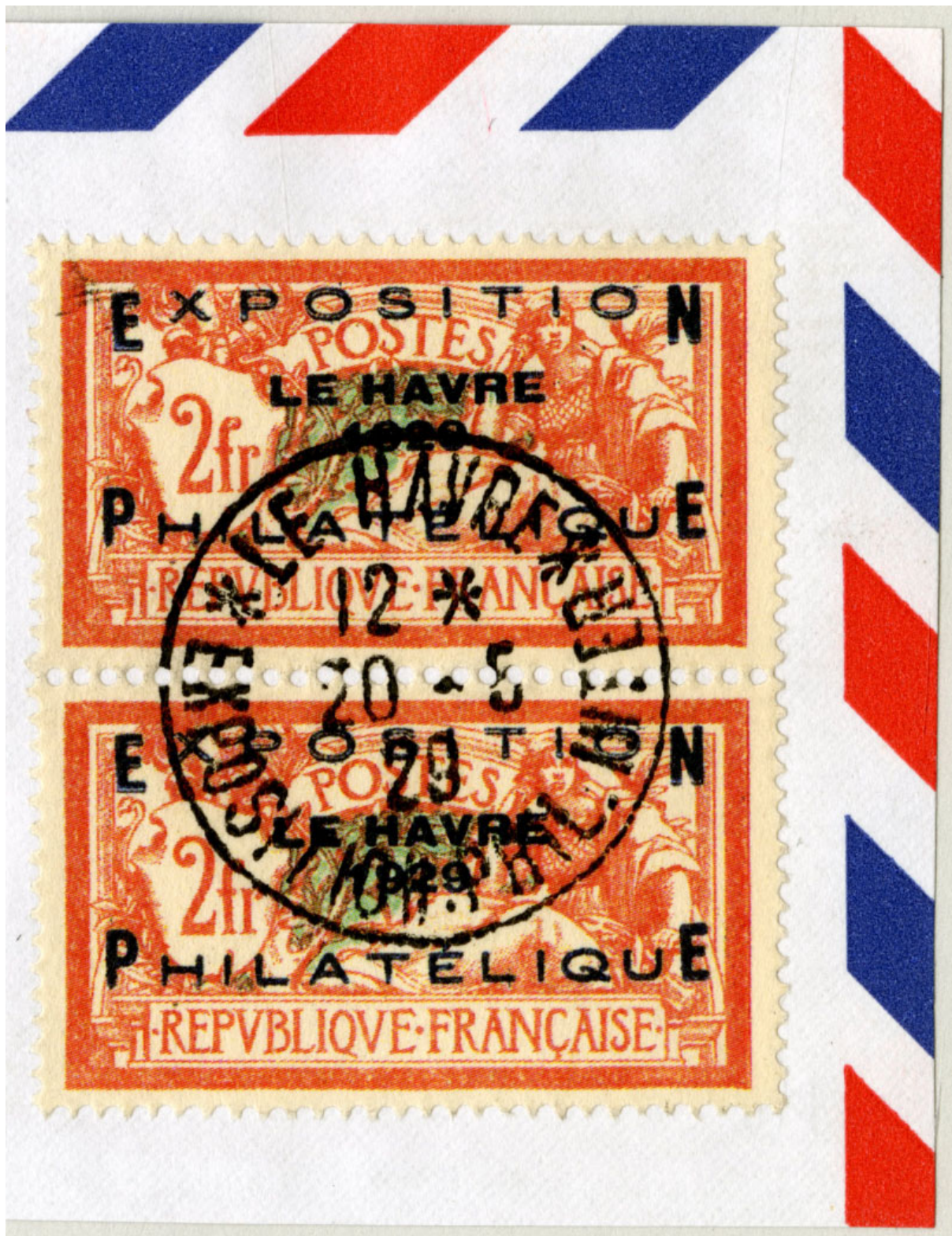
Helforfalskning af AFA 232 - her en usædvanlig grov reproduktion. Bemærk flere af de vandrette og lodrette linier er helt opdelt