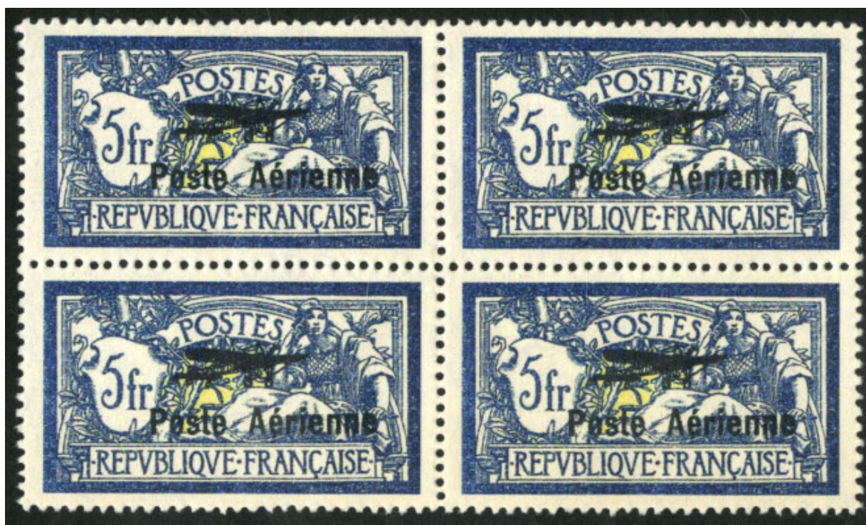
Falsk AFA 218 - luftpostudstilling i Marseille 1927