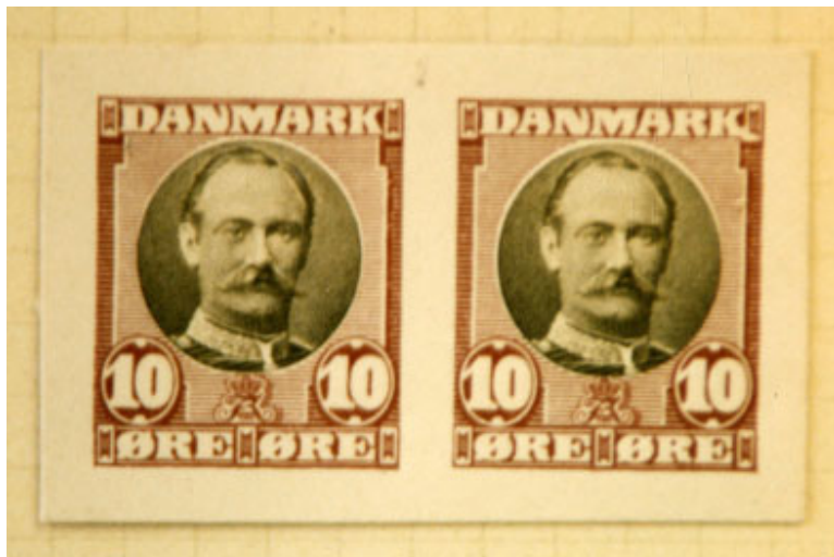
Kombinationstryk i to farver. Kongens hoved er trykt i kobbertryk og rammen i bogtryk

foresatte mente, at det da måtte være muligt at finde egnede farver til ensfarvede mærker.