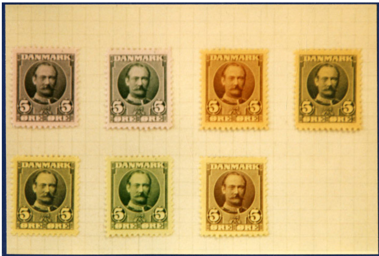
Forsøg med tryk på farvet papir i forskellige farver

Tofarvet kobbertryk måtte jo tidligt opgives. Tofar-