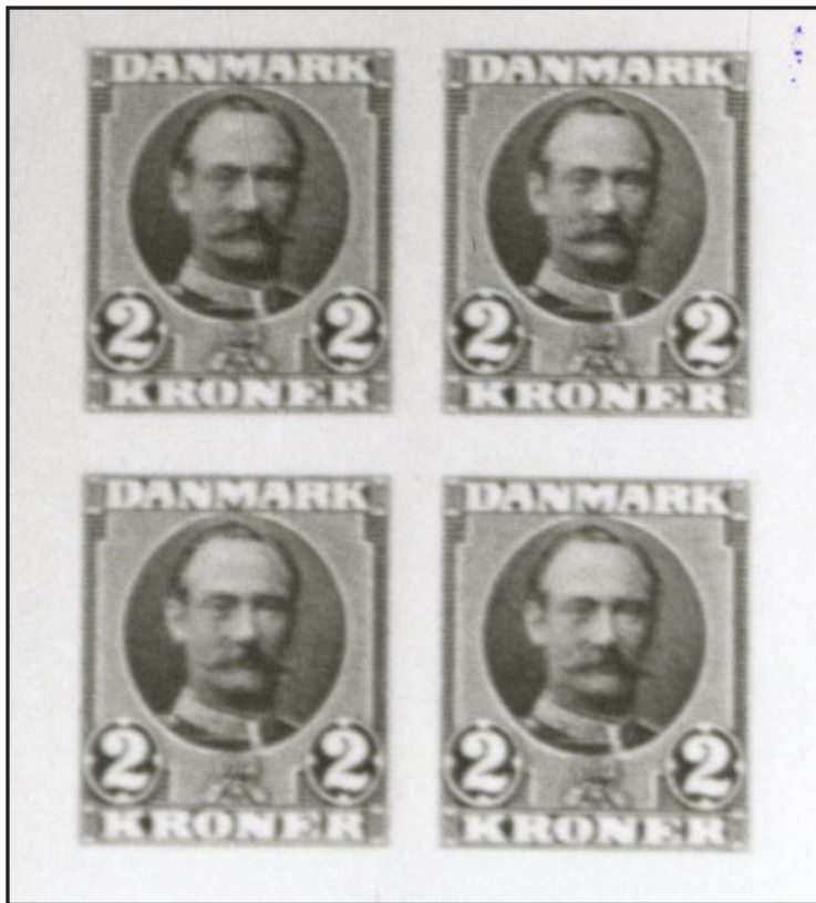
Provetryk af det endelige 2 kroners frimærke. Det forelå færdigt, men trykplader klar til produktion, da Kong Frederik VIII afgik ved døden 14. maj 1912. Efter nogen diskussion blev det besluttet ikke at udgive frimærket

1912). I Tegningen bør ske den Ændring, at Møntbetegnelsen ændres fra »Øre« til »Kroner« eller »Kr.« Det samme bør ske for det nugældende 100 Øres Mærke og her bør Ordningen ske, naar nyt Oplag skal trykkes.“ (Skrivelse af 14.8.1911)