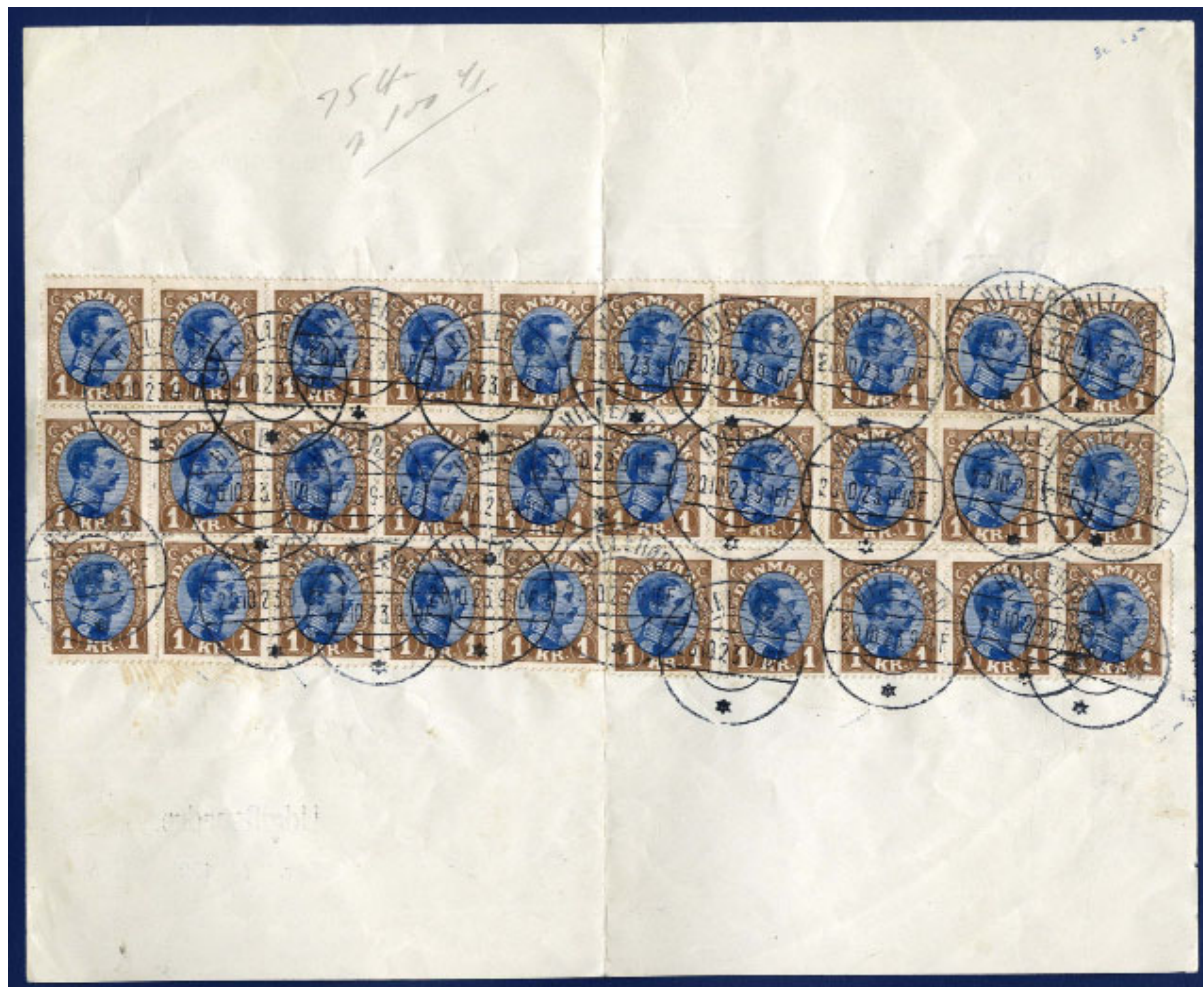
Fig. 1. Postkvittering for indlevering af 750 stk. tryksager uden adresse til omdeling i Hillerød Postkontors landdistrikt 23.10.1923. Takst: tryksager 0-50g: 4 øre, i alt 30 kr. Påsat 30 stk. 1 kr. 5. tryk i 5 striber, pos. 41-45, 51-55, 81-85, 86-90, 91-95 og 96-100. Forsiden af kvitteringen ses foroven.