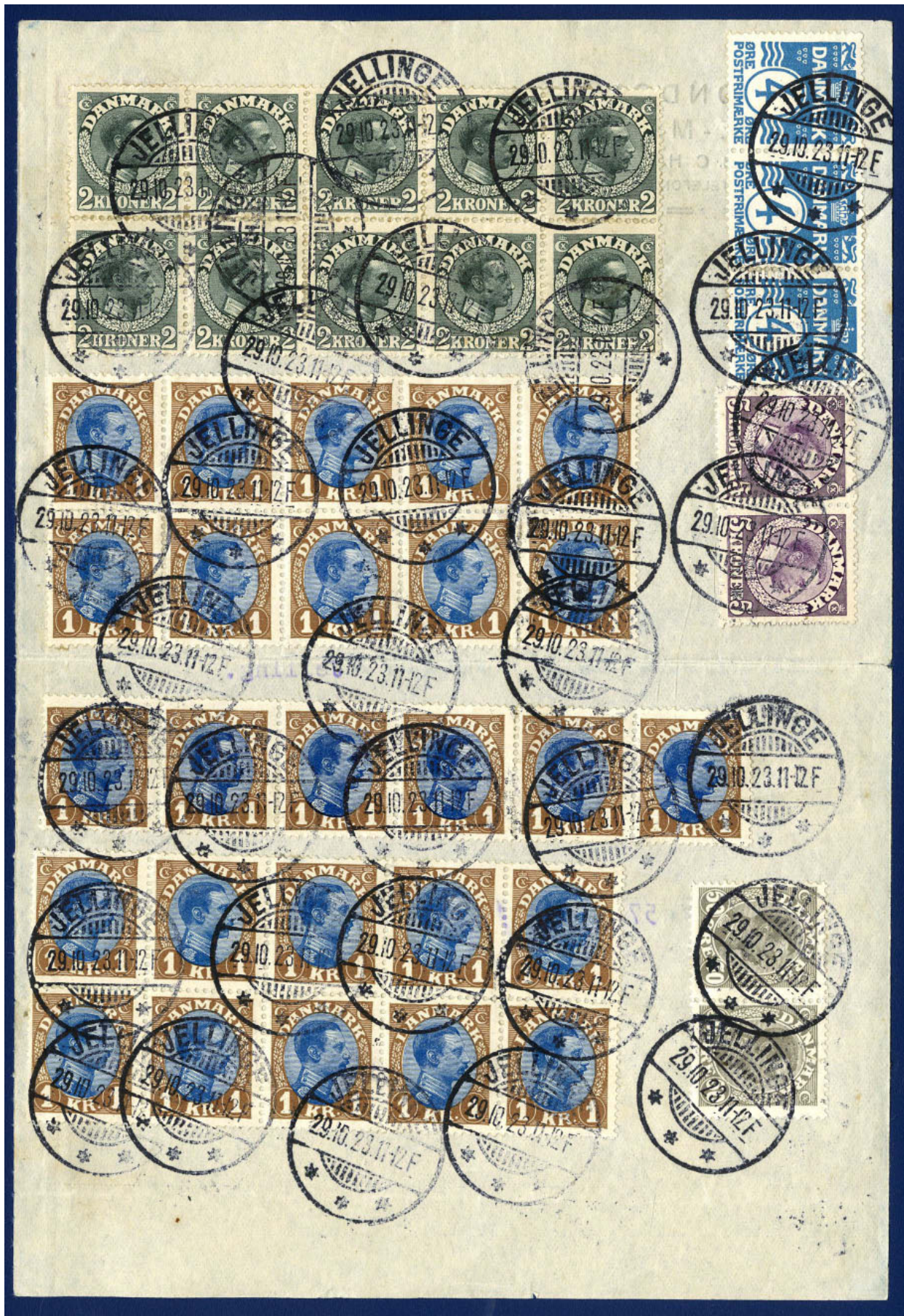
Kvittering for omdeling af 1428 „cirkularer“ for London Herre-Magasin i Vejle. Omdelingen skete til samtlige busstande i Jelling. 1428 x 4 øre er kr. 57,12. Frankeret med 1 kr. 5. tryk pos. 31-35, 41-45, samt 36-40, 46-50 samt 6 stribe 11-16. Bemærk pos. 33 plet i A, som her findes i 5. tryk