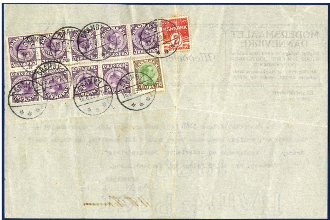
Fig. 1. Postkvittering for indlevering af 1168 stk. tryksager (bæfter) uden adresse (”Modersmaalet-Dannevirke”) til omdeling i Gramby postkontors distrikt og samtlige underlagte postdistrikter 15.6.1923. Takst: tryksager 0-50g, i alt kr. 46,72. Kvitteringen er ved en fejltagelse kun frankeret med kr. 45,72 selvom det fulde beløb er overført pr. postamvisning. Frankeret med 9 stk. 5 kr. kobbertryk 1 stk. 2 øre bølgelinie samt 1 stk. 70 øre 8. tryk

Taksterne var lavere end takster for tilsvarende adresserede forsendelser forsynet med frimærker.