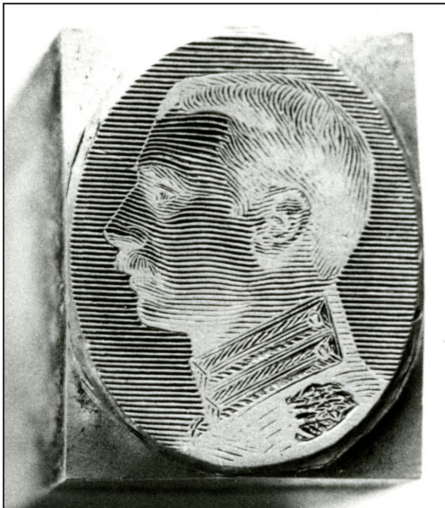
Foto af en af de overleverede medaillontrykklicheer fra Enigma. Dette er iøvrigt en type MM3. Museet har et komplet sæt på 100 enkeltklicheer