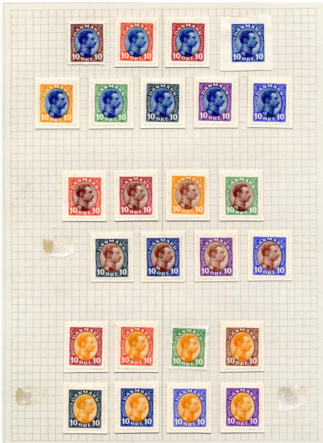
Provesamlingens karton P300 - farveprøver med medailloner i stålblå, brun og gul farve. Bemærk at beskrivelsen i kataloget ikke passer. Der er 25 farveprøver, ikke 26 som anført. Og prøverne er ikke uperforedede, men perforede. Der mangler 3 prøver, men de er taget fra som godkendte prøver til endelige frimærker